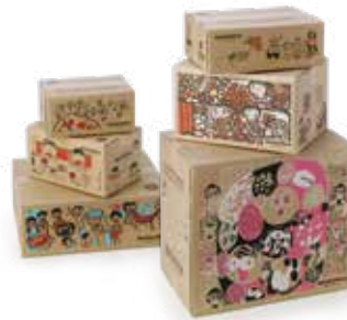
※写真の段ボールは過去に製作したもので、現在の仕様とは異なります。ご了承ください。

これらを作品公募プロジェクトとして以下の要領にて実施します。皆様の多数のご参加、ご応募を心よりお待ちしております。なお、企画・運営に関しましては、久原本家グループ新入社員によるプロジェクト体制で推進してまいります。